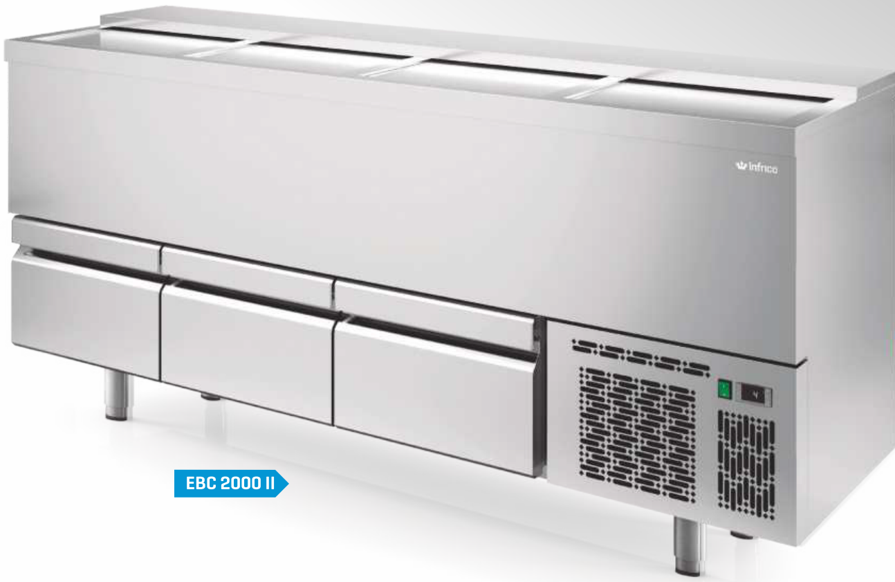
EBC 2000 II

Temperature regulated by a digital controller . Manual defrost. Ventilated condensation system. Gravity Evaporation system.